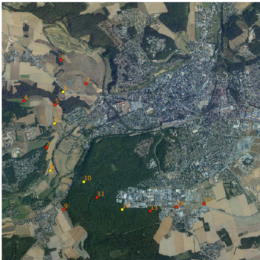
Carte n°1 : Localisation des points d'écoute nocturnes (en jaune)

Les rapaces nocturnes nicheurs (chouettes et hiboux) ont été recensés à partir de cinq points d'écoute. Deux passages sont effectués : le premier entre le 15 février et le 15 mars et le 2 ème entre le 15 mai et le 15 juin.